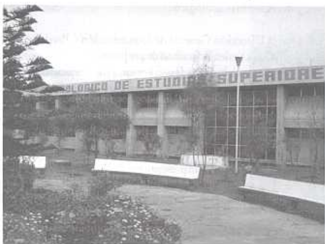
El TESE se compromete a la protección y preservación del ambiente

III.2. Que ambas instituciones poseen intereses comunes para impulsar las actividades que desarrolle: Difusión, Capacitación e Investigación Científica y Tecnológica, sobre problemas rela-