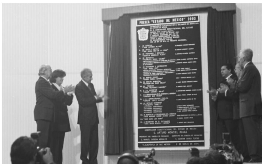
El Lic. Arturo Montiel Rojas, Gobernador Constitucional del Estado de México, devela la placa correspondiente a la Presea "Estado de México" 2003.