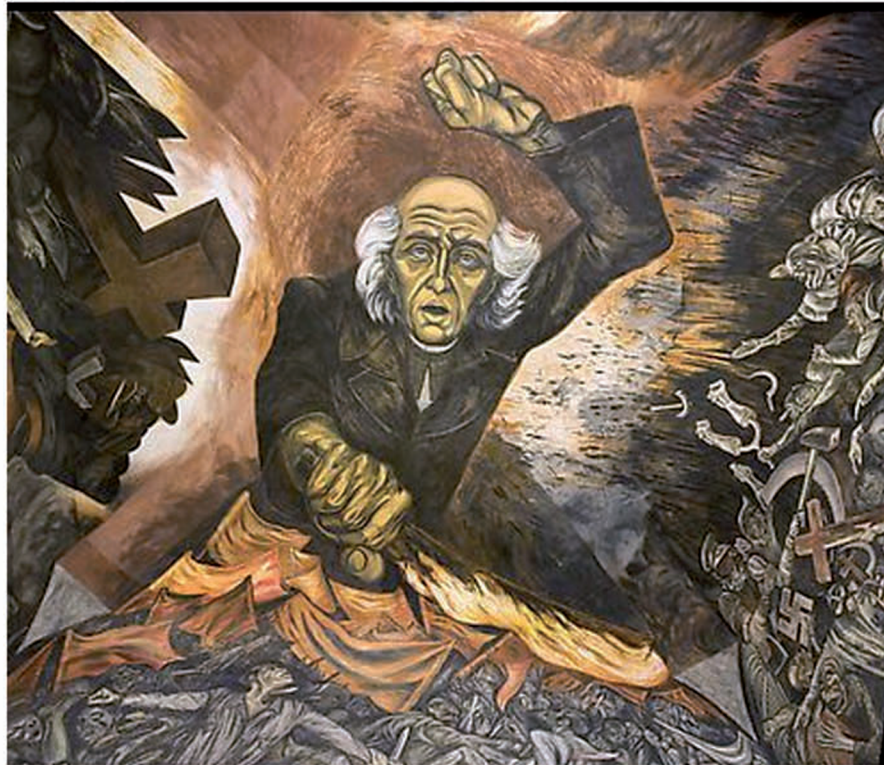
Mural de José Clemente Orozco, Palacio de Gobierno, Guadalajara, Jal.

Año del Bicentenario de la Independencia de México