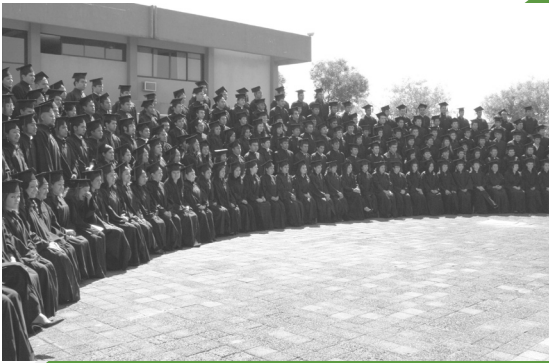
● Egresas la Generación 2055/2009-1

Órgano informativo del Tecnológico de Estudios Superiores de Ecatepec Año 13, número 87, Septiembre-Octubre 2009