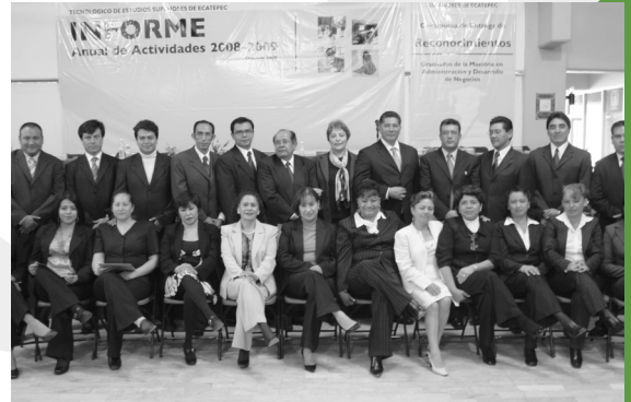
● Concluyen estudios alumnos de la Maestría en Administración y Desarrollo de Negocios