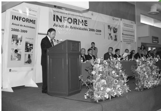
● Director General del TESE presenta Informe de Actividades 2008-2009